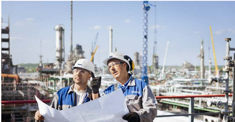
Voith Industrial Services ist branchenorientierter Anbieter technischer Dienstleistungen für Kunden aus der Energiewirtschaft und der Prozessindustrie.