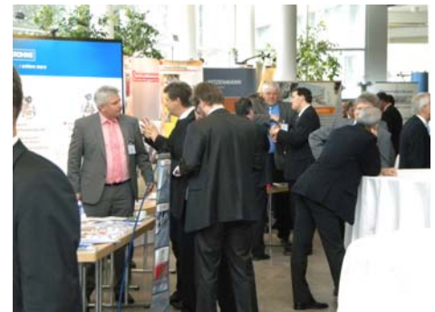
Ein intensiver Austausch mit Experten aus den eigenen Reihen erwartet die Teilnehmer am 1. WVIS-Technik-Tag 2011.